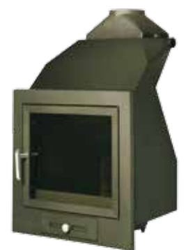
Hogar H-02 CALEFACTOR

Con carenado metálico para la redistribución del aire caliente de la cámara a través de su potente turbina (710 m 3 /hora) y su canalización a través de las cuatro toberas preparadas al efecto para su distribución a las distintas habitaciones.