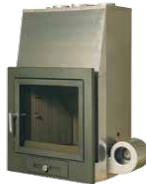
Hogar TC-1 TURBOCONVECTOR