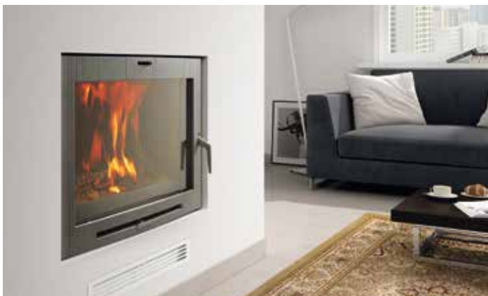
Hogar H-03 CURVO