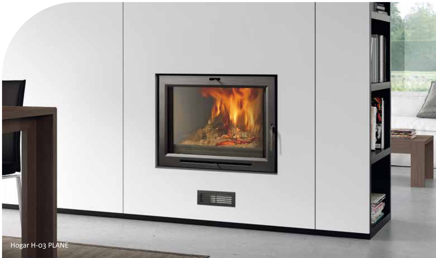
Hogar H-03 PLANE