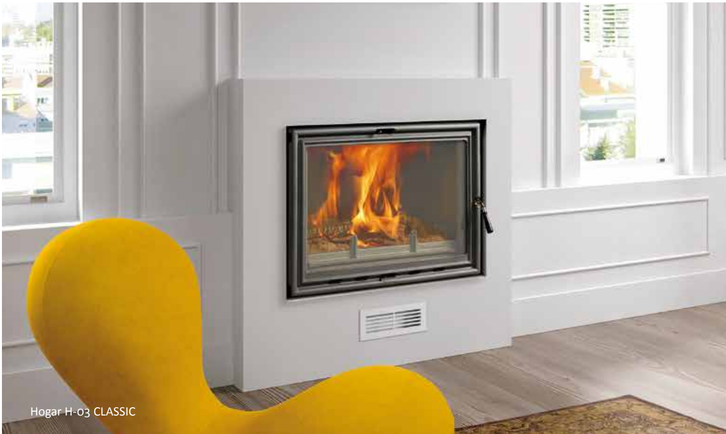
Hogar H-03 CLASSIC