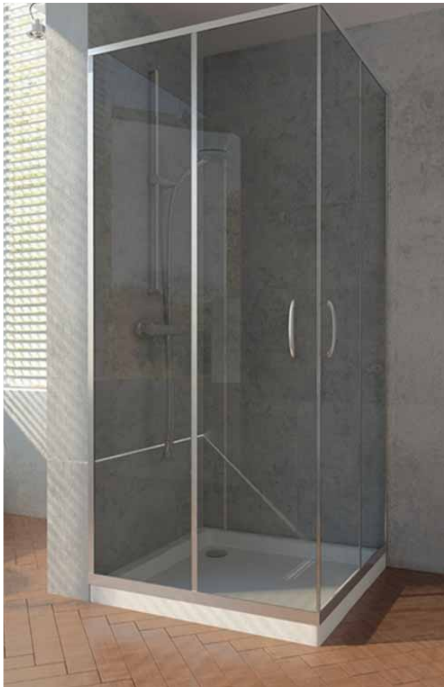
Mampara SAIMA / Angular cuadrada / 2 fijos y 2 correderas